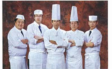
《グランドパレス川端グループ料理長》