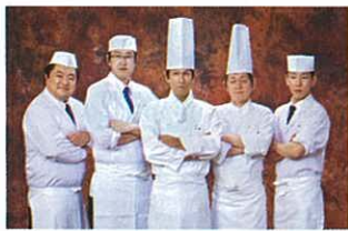
〈グランドパレス川端グループ料理長〉